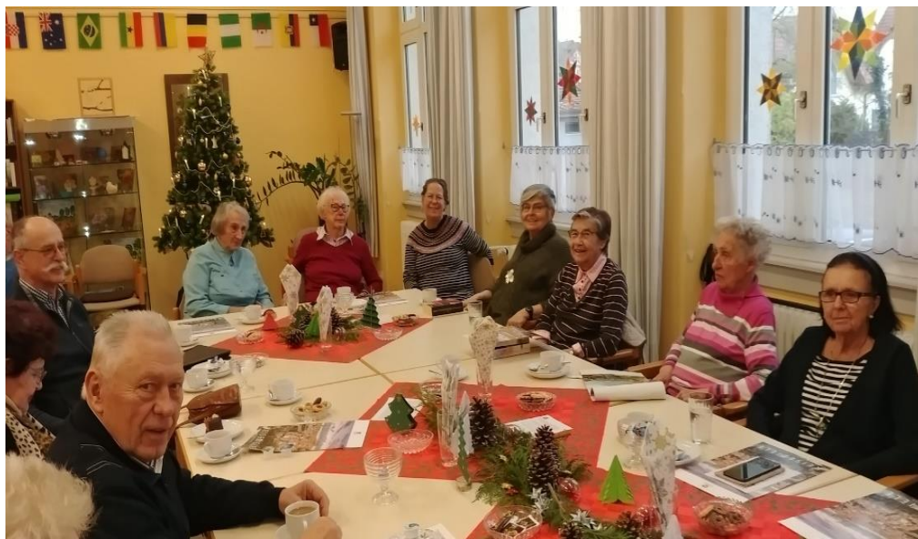
Bild: gemütliches Beisammensein an Nikolaus

Kommen Sie einfach zu einer Veranstaltung (fast immer kostenlos).