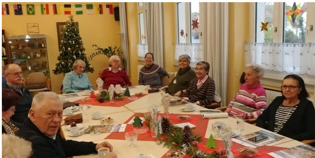
Bild: gemütliches Beisammensein an Nikolaus

Kommen Sie einfach zu einer Veranstaltung (fast immer kostenlos).